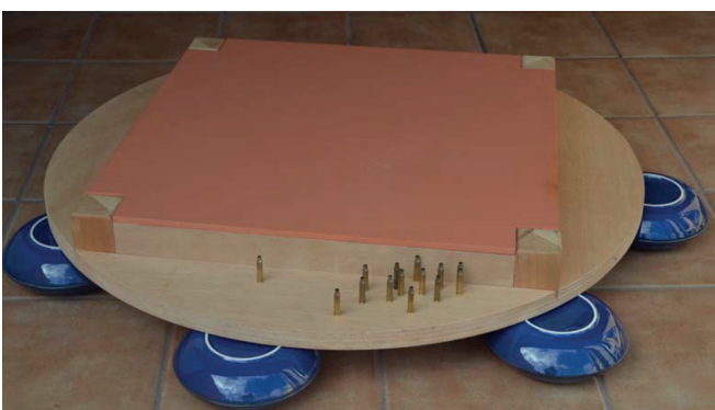
Fig. 1, Los secretos mejor guardados

Entre los años 2013 y 2019, se realizaron dos versiones de una misma instalación en la que los secretos eran los protagonistas. En estas imágenes (Fig. 1, 2 y 3), de dos de las versiones, la ausencia y la intención de indagar en una representación de los